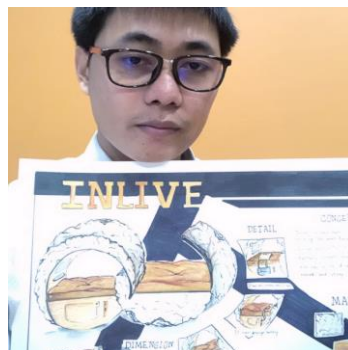
(1) ภาพตรงชัดเจน