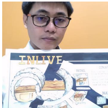
(2) ภาพชิ้นงานกับผู้เข้าสอบ

(ไฟล์ .jpg และ .pdf เท่านั้น ขนาดไม่เกินภาพละ 3 MB)